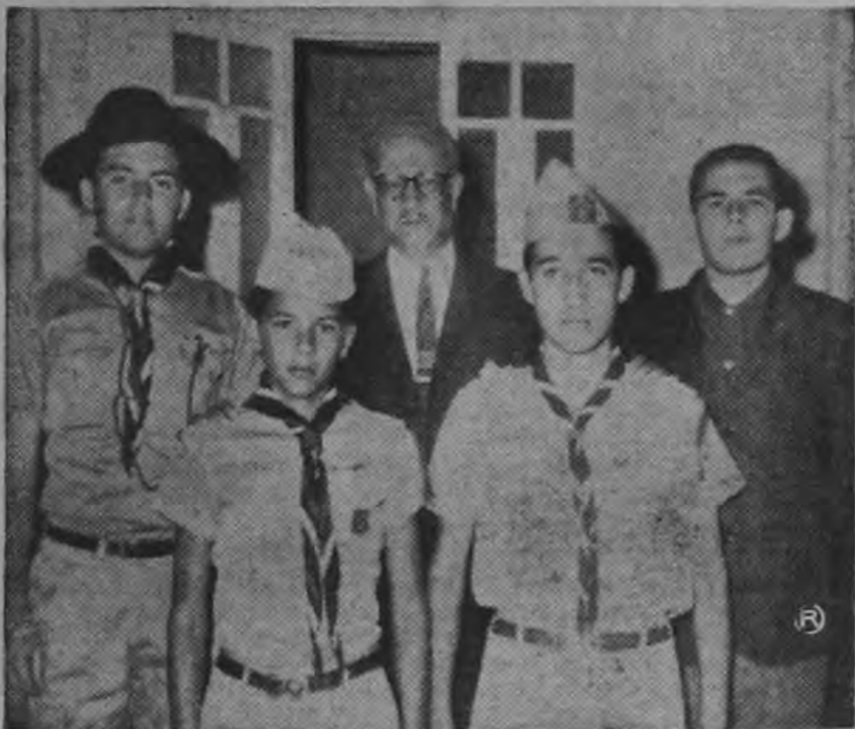
Integrantes del Grupo N° 17 de Scouts de Guadalupe, que el pasado martes visitaron en la Casa Presidencial al señor Ramón Villeda Morales, Presidente Honorario de los Scouts de Honduras, con el propósito de presentarle un saludo de bienvenida.